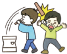
(例3) 不注意でお隣の方の頭に杵をぶつけケガをさせてしまった。