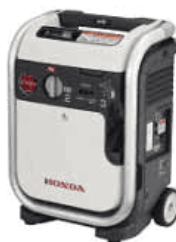
HONDA 発電機 ENEPO

自治会連合会会員には機材を貸出します。デモンストレーション用の発電機(enepo)、プロジェクター、スクリーン、パソコンなど、事務局でお申し込みください。貸出・返却日や方法についてはご相談下さい。