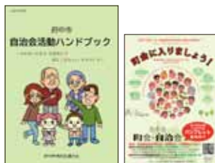
自治会活動 ハンドブック 町会に入ろう パンフレット

パンフレット各種事務局にご用意しています。また、ホームページからもダウンロードください。