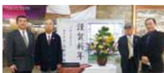
左から筒井副会長・志水会長・谷本事務局長・棟田事務局長