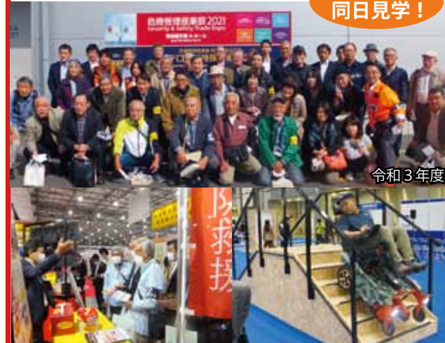
危機管理産業展 国際福祉機器展

【危機管理産業展】防災・減災・セキュリティあらゆるリスクに対処する危機管理をテーマにした国内最大級の総合トレードショーです。リアル展ならではの実演や体験企画など多数出展。