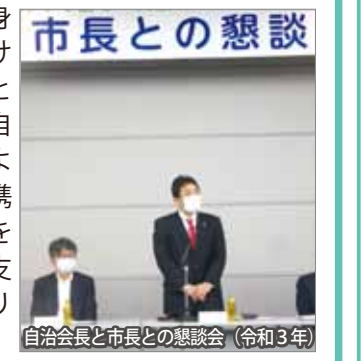
自治会長と市長との懇談会(令和3年)

☆(回答) .....(前半略) これまでの自治会における顔の見える関係が希薄化するなど、自治会の活動・運営におきましては、様々な影響が生じているものと認識しております。本市といたしましては、地域住民の皆様の生活に一番身近な自治会の活動はかけがえのないものであると考えておりますので、自治会が活性化できるよう、自治会連合会と連携しながら、オンラインを活用した取組について支援するよう務めてまいりたいと考えております。