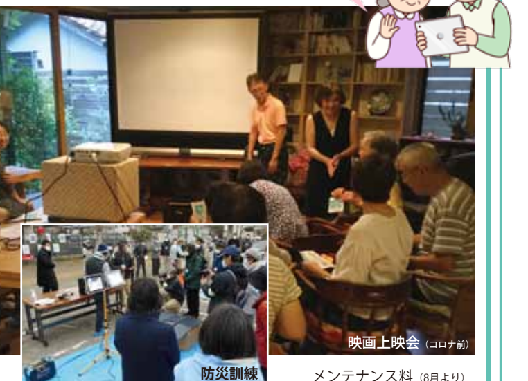
映画上映会(コロナ前)