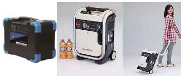
ポータブル蓄電池 POWER VALUE SAVER カセット発電機 HONDA ENEPO

デモンストレーション用の発電機(enepo)、蓄電池、プロジェクター、スクリーン、パソコンなど、事務局でお申し込みください。貸出し・返却日等はご相談下さい。