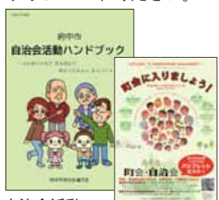
自治会活動ハンドブック 町会に入ろうパンフレット

パンフレット各種事務局にご用意しています。また、ホームページからもダウンロードください。